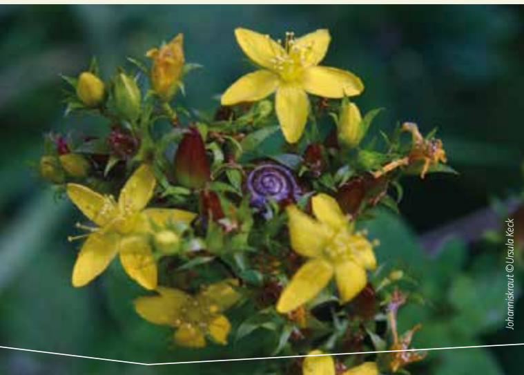
Johanniskraut